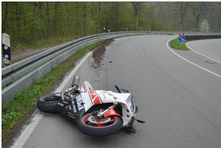
Unfall am Unterfahrschutz

„ON 01 befuhr mit seinem Krad, XX – XY 99, die B 463 von Nagold in Richtung Wildberg. In einer lang gezogenen Linkskurve (sog. "Bettenbergkurve") kippte das Krad infolge nicht angepasster Geschwindigkeit auf die linke Fahrzeugseite. Von der Fahrstreifenmitte an rutschte das Krad 41,5 Meter zum rechten Fahrbahnrand, bis es gegen den Unterfahrschutz an der Schutzplanke prallte. Nachdem es von dort abgewiesen wurde, rutschte es weiter auf der linken Fahrzeugseite bis es nach 46,4 Meter erneut gegen den Unterfahrschutz der Schutzplanke prallte. Von dort schlitterte es weitere 28,20 Meter, wieder auf der linken Fahrzeugseite auf der Fahrbahn, bis es zur Unfallendlage kam. Der Fahrer löste sich rechtzeitig von der Maschine und wurde nur relativ leicht verletzt (Schnittwunde an der Ferse und Verdacht auf Achillessehnenabriss). Im Bereich der ersten Kollisionsstelle mit dem Unterfahrschutz der Schutzplanke, wurden zwei Elemente des Unterfahrschutzes verbogen. Der Fremdschaden an der Schutzplanke beträgt ca. 300 Euro.“